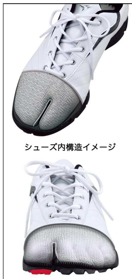
シューズ内構造イメージ