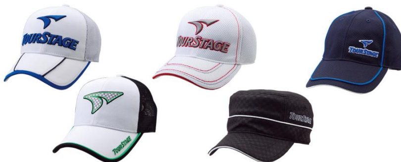
ウォータークールダウンキャップシリーズ