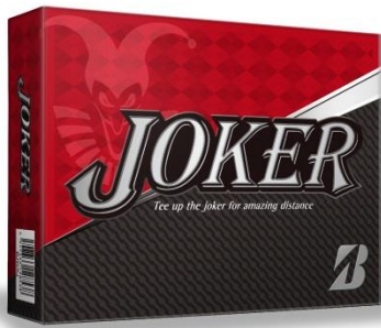
BRIDGESTONE GOLF JOKER