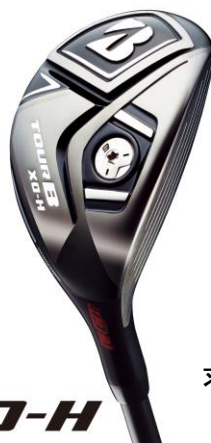
『TOUR B XD-H』 求めるイメージ通りの弾道と 飛距離性能の追求