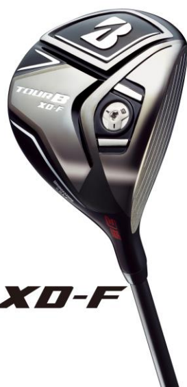
『TOUR B XD-F』 番手別飛距離性能と 打感の良さを追求

*上記の価格は、フェアウェイウッドは TOUR B オリジナルの「TOUR AD TX 1 -6F」シャフト仕様時、ユーティリティは同「TOUR AD TX 1 -6H」シャフト仕様時です。メーカー希望小売価格は、参考価格です。