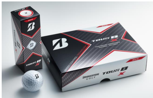
【TOUR B X】