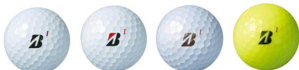
ホワイト ホワイト パールホワイト イエロー コーポレートカラー