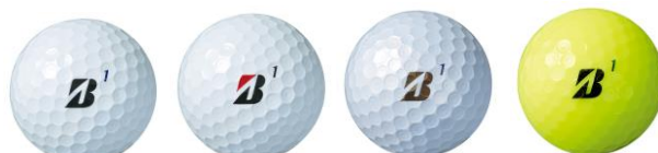
ホワイト ホワイト パールホワイト イエロー コーポレートカラー