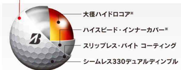
ウレタンカバー3ピース構造 ※各モデル毎に最適化しています。

衝撃吸収材を配合した新開発カバーによりアプローチショットの初速を抑え、コントロール性が向上。