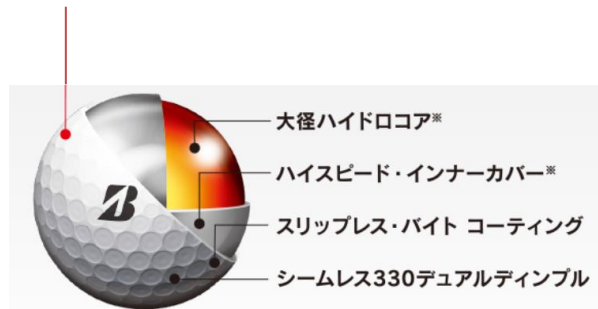
ウレタンカバー3ピース構造 ※各モデル毎に最適化しています。