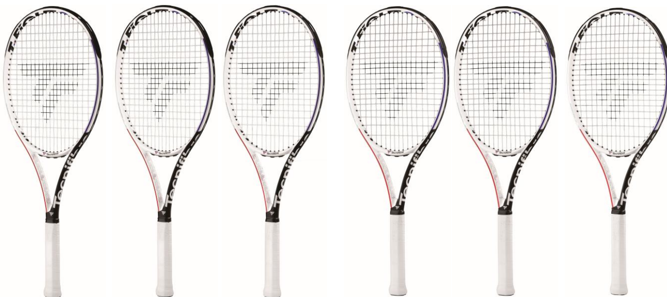
【T-FIGHT rs 315】【T-FIGHT rs 305】【T-FIGHT rs 300】 【T-FIGHT rs l 295】【T-FIGHT rs l 280】【T-FIGHT rs l 265】