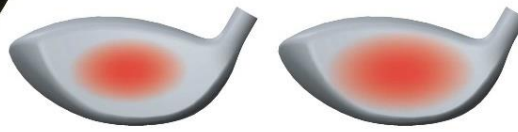
※従来品 反発イメージ

フェースの薄肉化により トゥ、ヒールの反発性能アップ 許容性が向上し、 飛距離ロスを軽減!!