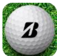
ブリヂストンゴルフ 公式アプリアイコン