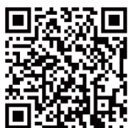
ブリヂストンゴルフ 公式アプリ QR コード